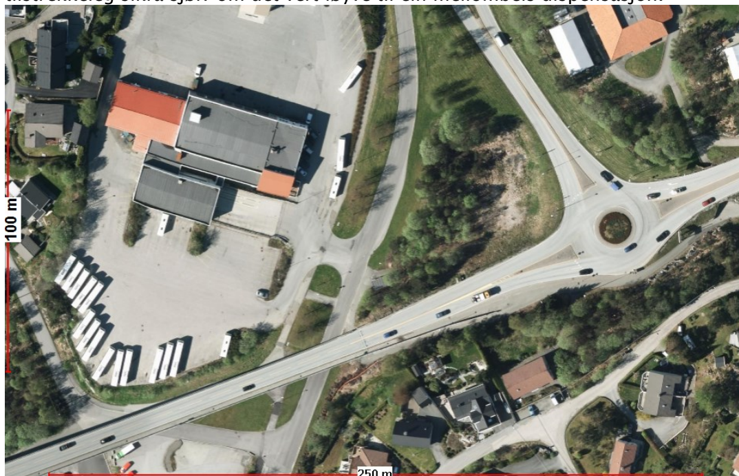
Ortofoto med dagens situasjon.

Når det gjeld dispensasjon frå regulert byggjegrænse har vi ikkje vesentlege merknader til dette, under føresetnad at det vert sikra for at tiltaket er av mellombels karakter. Veganlegget i områdeplanen er ikkje bygd ut, og tiltaket er lokalisert utanfor byggjegrænser langs offentleg veg i høve til dagens vegsituasjon. Vi vurderer at forholda som byggjegrænsa skal ta i vare er tilstrekkeleg sikra sjølv om det vert løyve til ein mellombels dispensasjon.