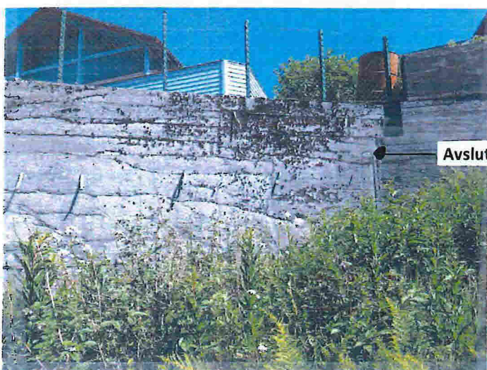
Avslutning mot 185/214