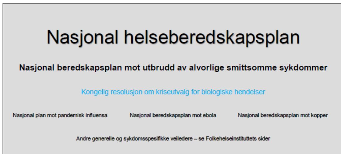
Tabell 1. Nasjonal beredskapsplan mot utbrudd av alvorlige smittsomme sykdommer

Nasjonalt plan mot alvorlige smittsomme sykdommer må leses i sammenheng med underliggende nasjonale planer for henholdsvis ebola, kopper og pandemisk influensasykdom. Disse planverkene er relevante for alle nivåer av norsk helsetjeneste. I tillegg er det utgitt ulike veiledere: