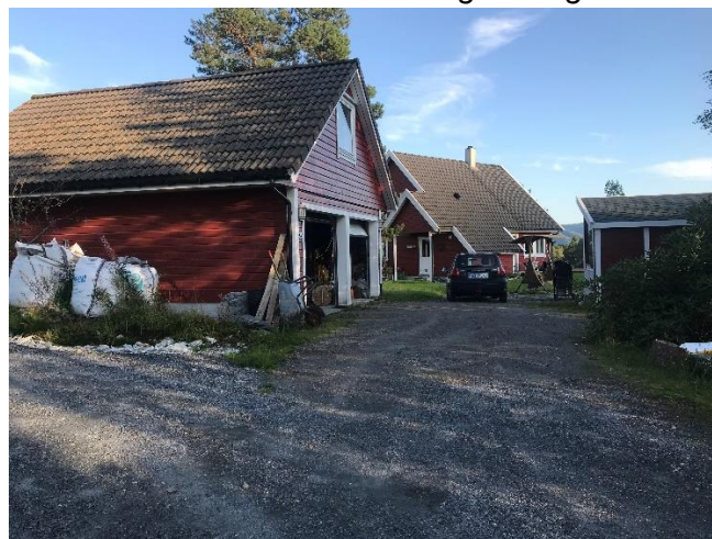
202/130 sett fra innkjørsel, sørlig retning