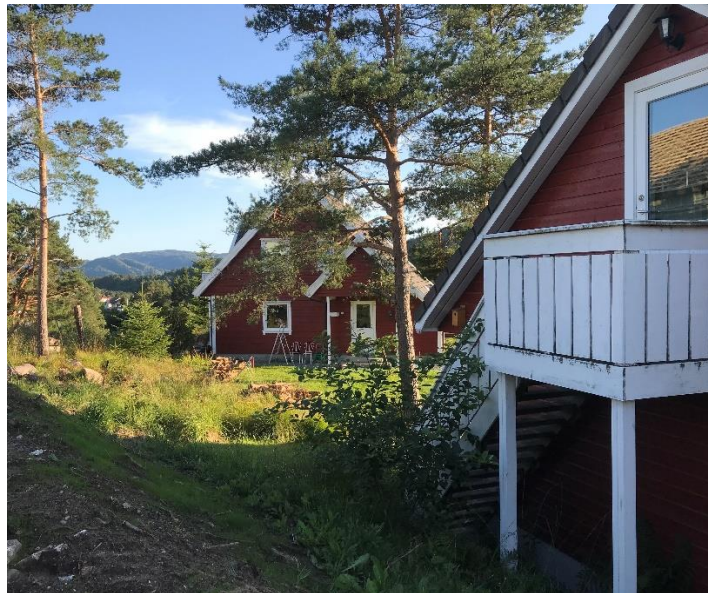
202/130 sett mot sørlig retning