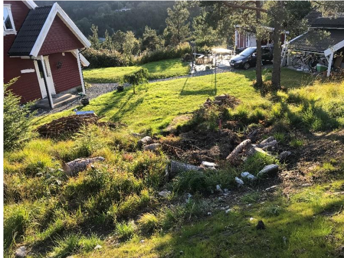
202/130 sett mot vestlig retning