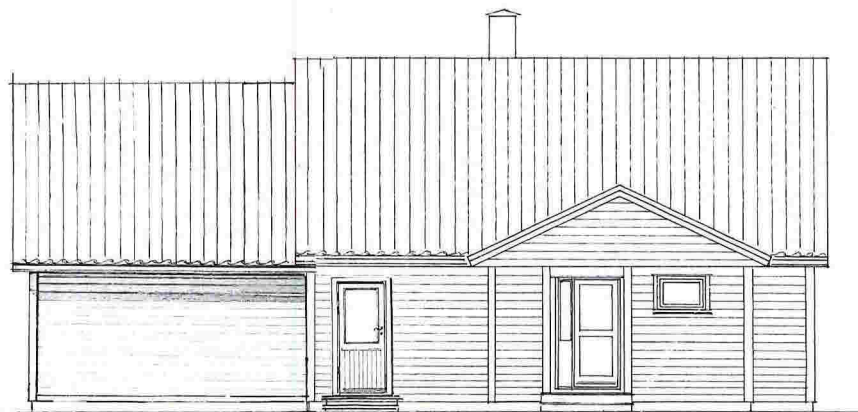
Endret fasade mot SYD-ØST