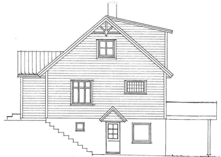
fasade mot NORD-VEST

Gnr. 137 , Bnr. 127 i Lindås kommune , Kubbaleitet 14, 5914 Isdalstø Fasader i Mål = 1 : 100