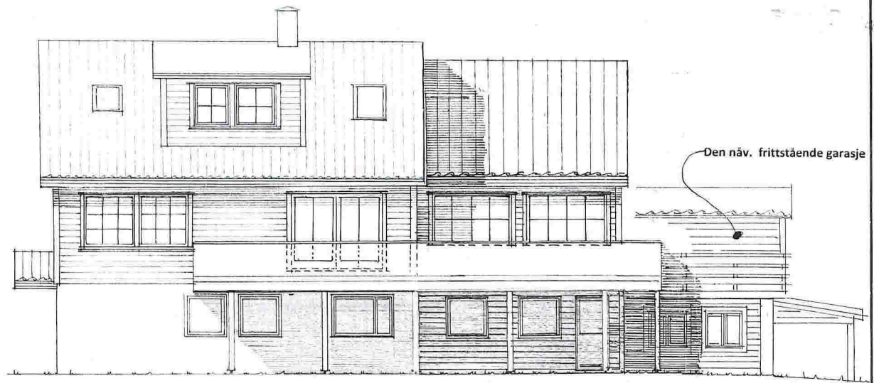
Endret fasade mot SYD-VEST