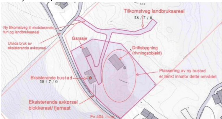
Situasjonskart, datert 22.06.18

Tiltakshavar ønskjer å frådele eksisterande tun, behalde eksisterande bustad og oppføre ny einebustad samt etablere ny tilkomstveg. Bustad på eksisterande tun har ein burett som gjer at tiltakshavar ikkje kan