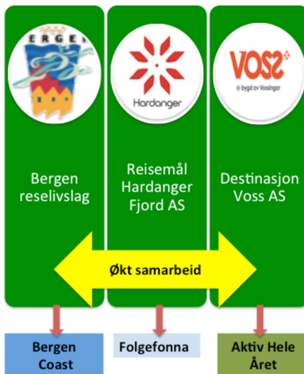
Figur 2. Forslaget til ny struktur basert på tre destinasjonsselskap og sentrale strategiske produkt/markedsprosjekt

Gjennom prosessen i dette prosjektet har destinasjonsselskapene satt fokus på heve egen effektivitet og bedre ressursutnyttelse i tillegg til de strukturelle endringene innenfor geografi. Følgende arbeidsoppgaver ble trukket frem med potensial for samordning mellom de tre selskapene: