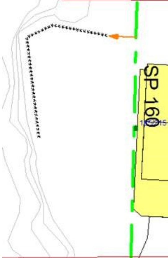
Utsnitt situasjonskart, datert 11.06.2018