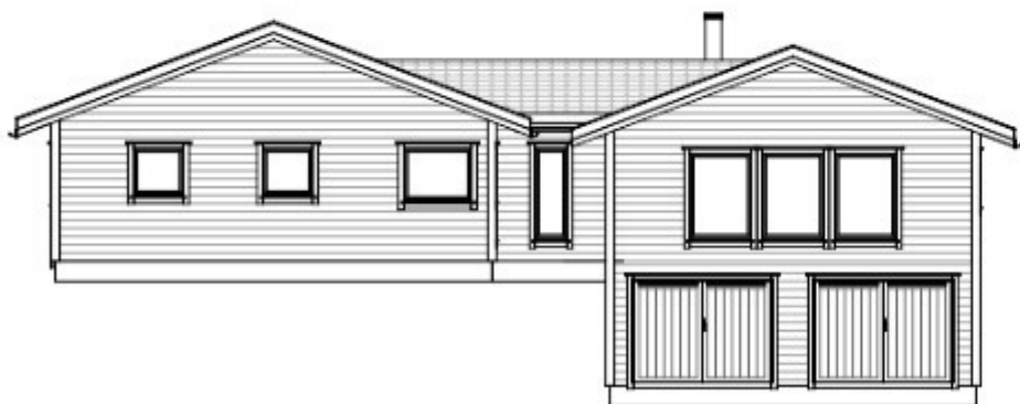
FASADE 3 1 : 100