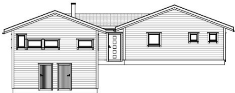
FASADE 1 1 : 100