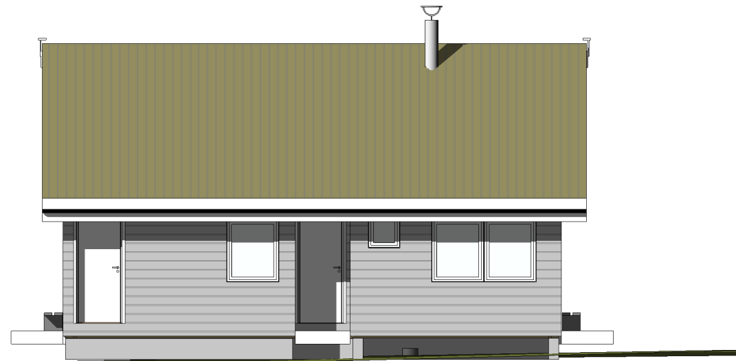
Nord 1 : 100