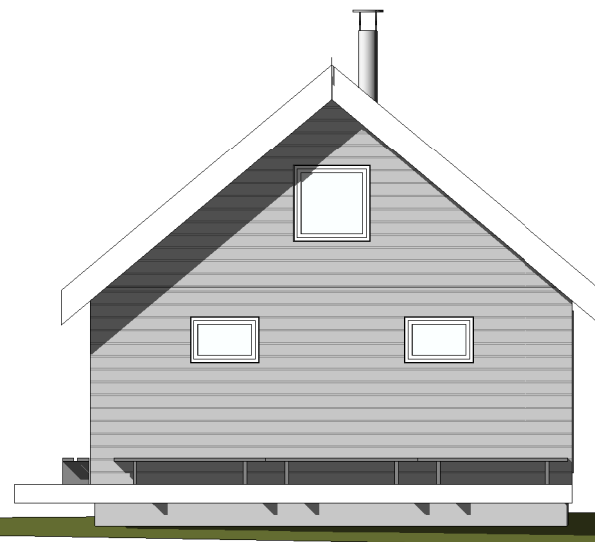
Øst 1 : 100