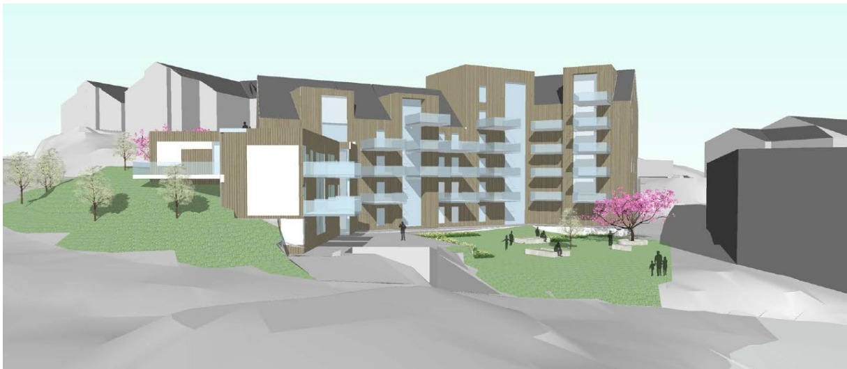
13 – Skisseprosjekt sett frå sørvest