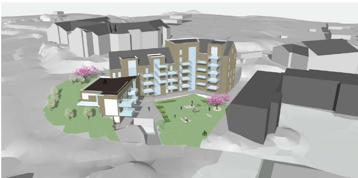
11 – Skisseprosjekt sett frå sør