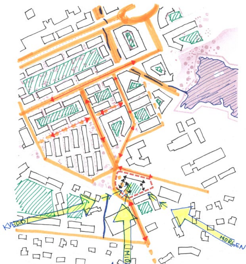
9 - Stadanalyse for plangrep