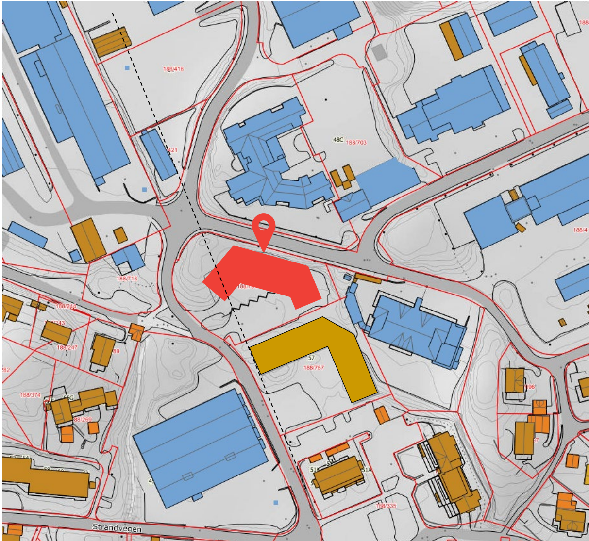
7 – Kart som syner bygningsstrukturar i området