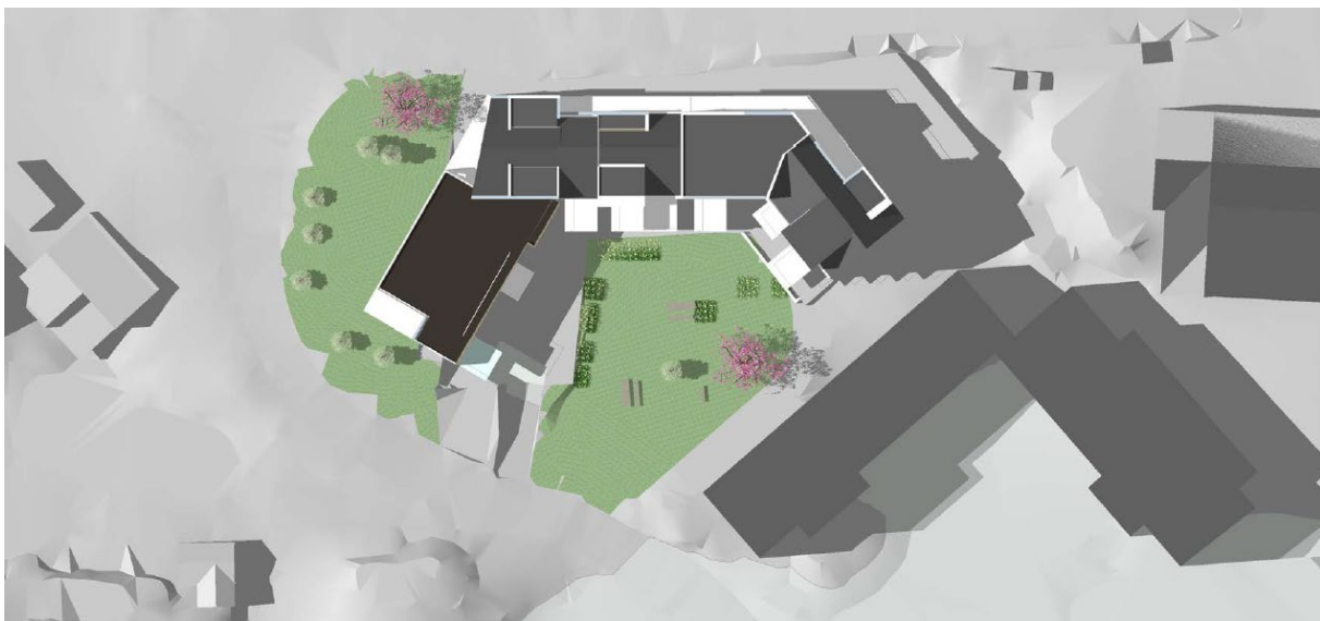
10 – Takplan for skisseprosjekt

Og Arkitekter har utarbeidd eit skisseprosjekt for tomta, med om lag 35 bustader. Tomta er utforma med eitt bygg som følgjer gateløpet i nord, og opnar seg mot sør med solrike uteopphaldsareal. For å opne uteareala opp, utfordrar plangrepet områdeplanen i noko grad. Bygningsdelen i vest ligg dels utføre byggerensa i områdeplanen. Dette er foreslått for å opne uteområda, og kompensert med å halde seg lågare enn utsynspunkta nord for tomta. Ein har òg valt å foreslå noko høgare bygg i austre del. her vil byggehøgda i lita grad verke negativt, og ein kan ha lågare høgder på ander deler av tomta for å betre soltilhøve for både dette og tilgrensande eigedomar. Utnyttingsgraden i skisseprosjektet ligg på om lag 120% BRA. Da er parkeringsgarasjen inkludert. Med denne utnyttingsgraden vil ein framleis tilfredsstillе krava til uteopphaldsareal på ein god måte. Ein har da til hensikt å sikre høge krav til kvalitetar og utforming av både bygg og uteområde i planarbeidet.