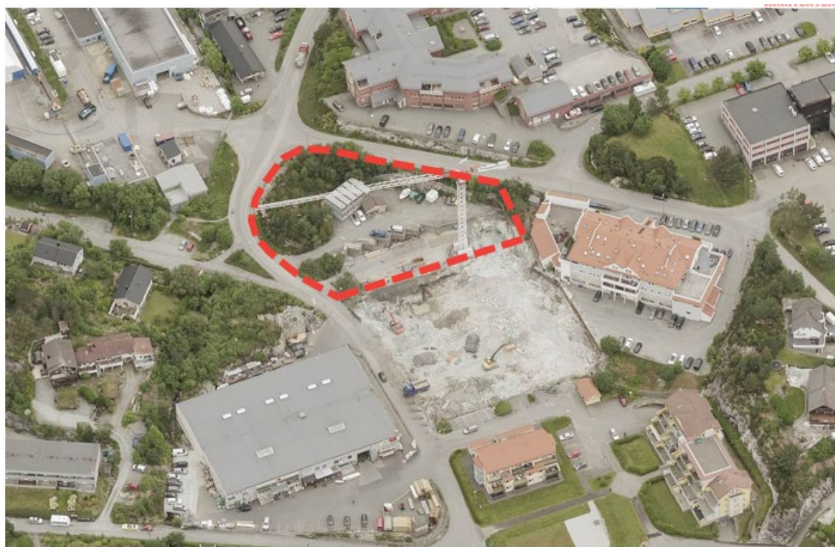
2 – Planområdet sett på skråfoto