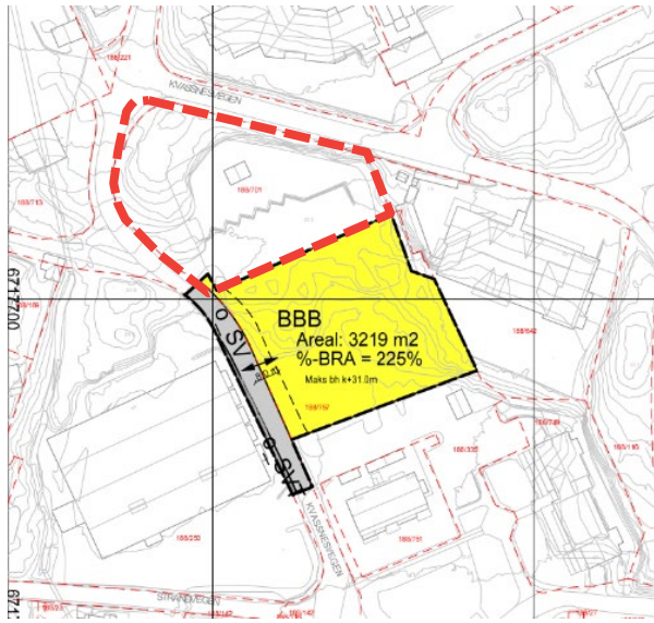
5 – Knarvik terrasse, reguleringsendring (godkjent 27.05.2015)