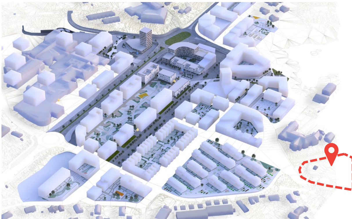
8 . 3D-illustrasjon for områdeplanen Knarvik

Figuren under syner strukturen som ligg til grunn i områdeplanen for Knarvik, saman med eksisterande bygg som ikkje ligg i områdeplanen sine illustrasjonar eller heilt utanfor områdeplanen.