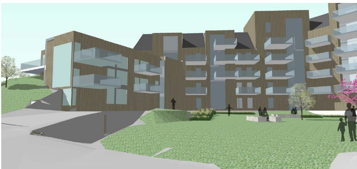
14 – Nærbilete av uteopphaldsareal frå skisseprosjektet