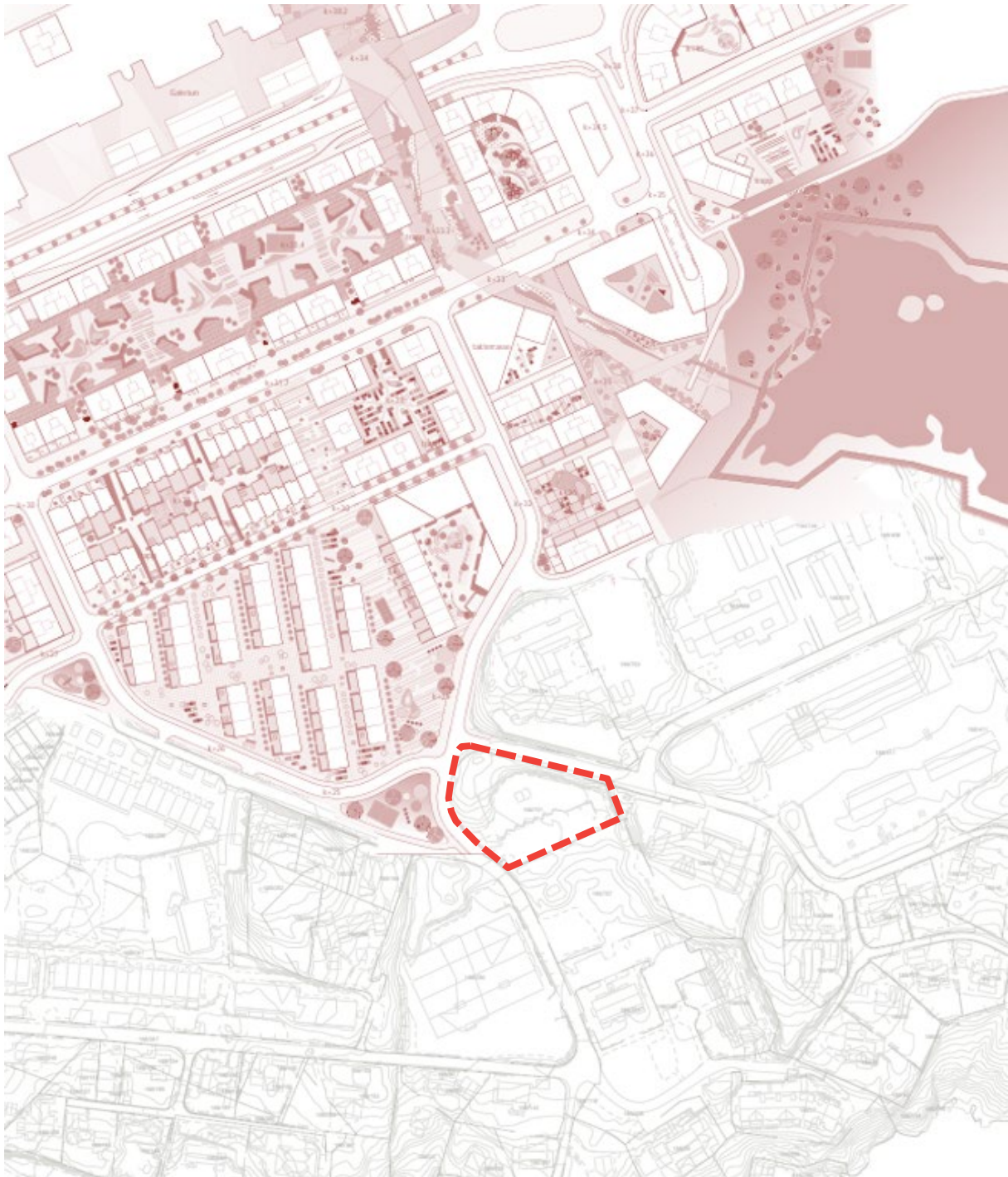
6 – Illustrasjonsplan for områdeplan for Knarvik og planområdet