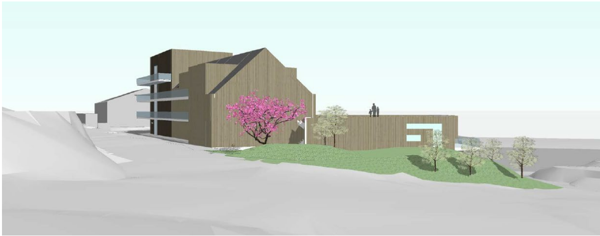
12 – Skisseprosjekt sett frå nord (Kvassnesvegen)