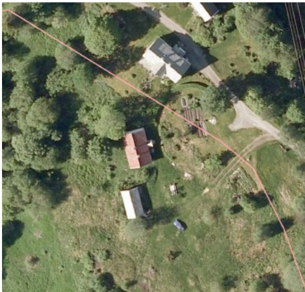
Eiendomsfoto før retting