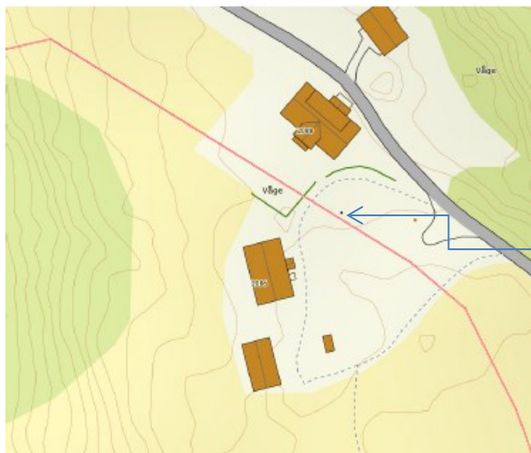
Eiendomskart før retting