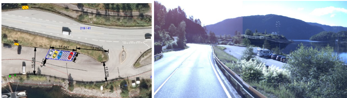
Illustrasjon vedlagt søknad (t.v) og vegbiletet 2017 (t.h).

Areal til parkering må følgje Handbok N100. Illustrasjon av parkeringsløyising som var vedlagt søknaden viser skråstilt parkering 5x60°. Vi rår til at kommunen utarbeider ein oppmerkjingsplan for heile området, slik at ein får tydleg oppmerking som avgrensar vegareal og parkering. Kommunen må vurdere korleis trafikantar skal manøvrere seg inn og ut av parkering på ein trafikksikker måte før arealet vert endeleg merka og sørge for at det er tilstrekkeleg areal til køyrebane.