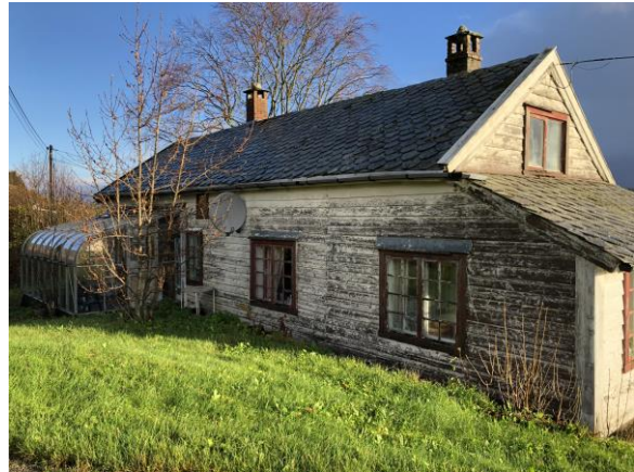
Bilde eksisterande bustad

Det er tiltakshavar sitt ynskje å sikra seg eige areal for bustad med tanke på overdraging og vidareføring av garden. Det vil vera naturleg at det som i praksis er hovudhuset vert høyrande til garden med tanke på standard på huset og i forhold til plassering mot driftsbygning og landbruksarealet på øst sida av vegen.