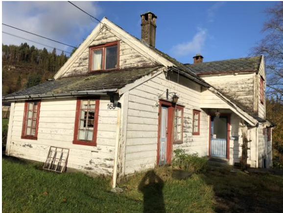
Bilde eksisterande bustad

Infrastruktur for den parsellen som vert frådelt er ivareteke, det er sikra vegrett som vist i vedlegg Q-1, offentleg vatn og avløp ligg i tomtegrensa. I og med at det i dette tilfelle er tale om å riva eksisterande bustad og erstatta med ny anser me det ikkje som utvida bruk og at avkjøring til offentleg veg difor er sikra.