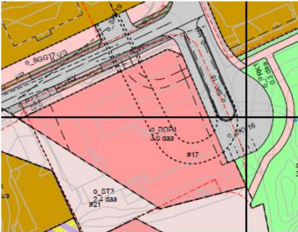
Utsnitt Områdeplan knarvik sentrum gbnr 188/323