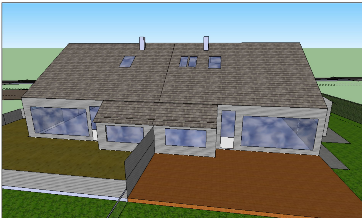
Viser sørvest-siden. Boenheten t.h.