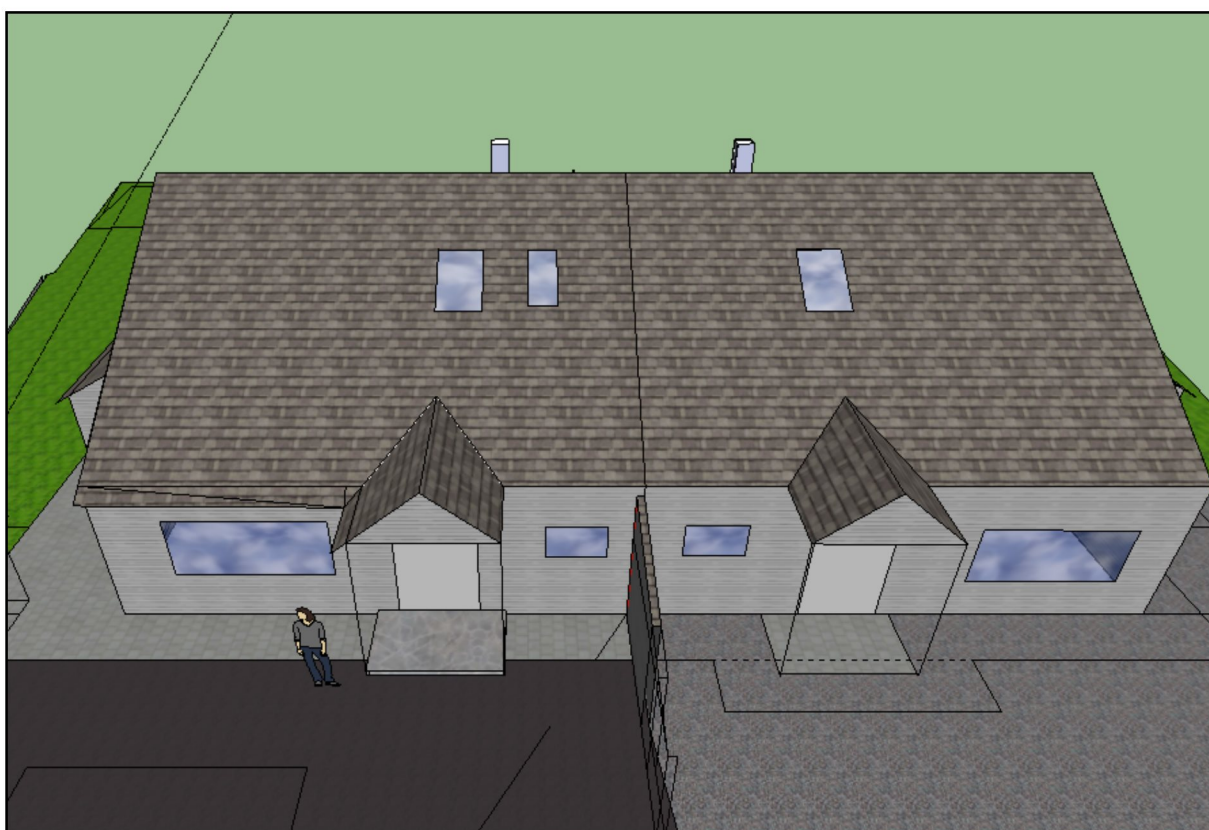
Viser nordøst-siden. Boenheten t.v.