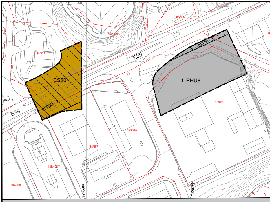
VERTIKALNIVÅ 1 - under grunnen M = 1:1000

N:\5170657\70657\BIM\Arealplan\K1\LAY_REGULERING_E39-KNARVIK-SENTRUM_5170657.dwg - Måbø - Plottet: 2018-05-04, 15:26:46 - LAYOUT = A1 - XREF = T:REGULERING_KNARVIK-SENTRUM_V1_5170657.T:REGULERING_KNARVIK-SENTRUM_linj_5170657.T:REGULERING_KNARVIK-SENTRUM_bak_5170657.T:REGULERING_KNARVIK-SENTRUM_V2_5170657.T:REGULERING_KNARVIK-SENTRUM_V2_5170657