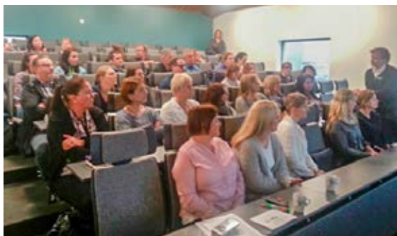
Interkommunal informasjon om nytt utstyr og prosjektet for tilsette i nye «ALVER» kommune.

Auka tilfredsheit i tilsette sin arbeidssituasjon gjennom i større grad å gje hjelp til sjølvhjelp/arbeide tverrfagleg.