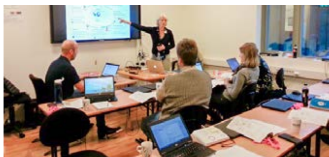
Opplæring av superbrukarar i Lindås ved Vakt og Alarm og Imatis: