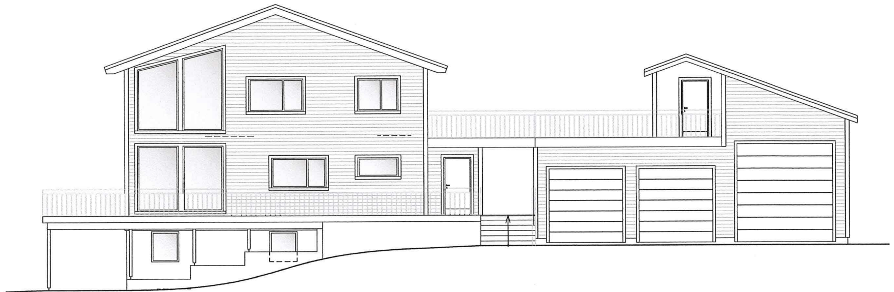
A, FASADE MOT SØRØST