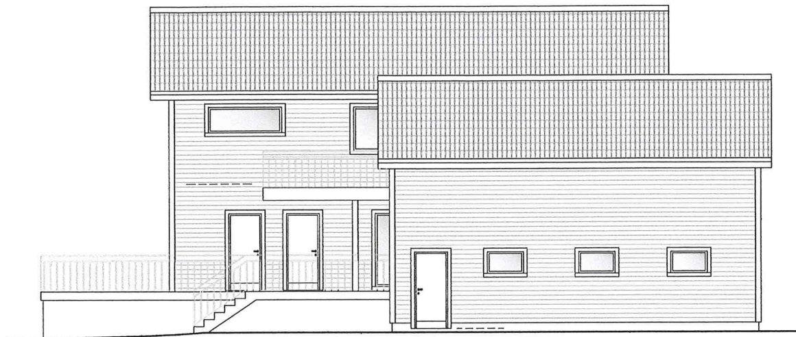
B, FASADE MOT NORDØST