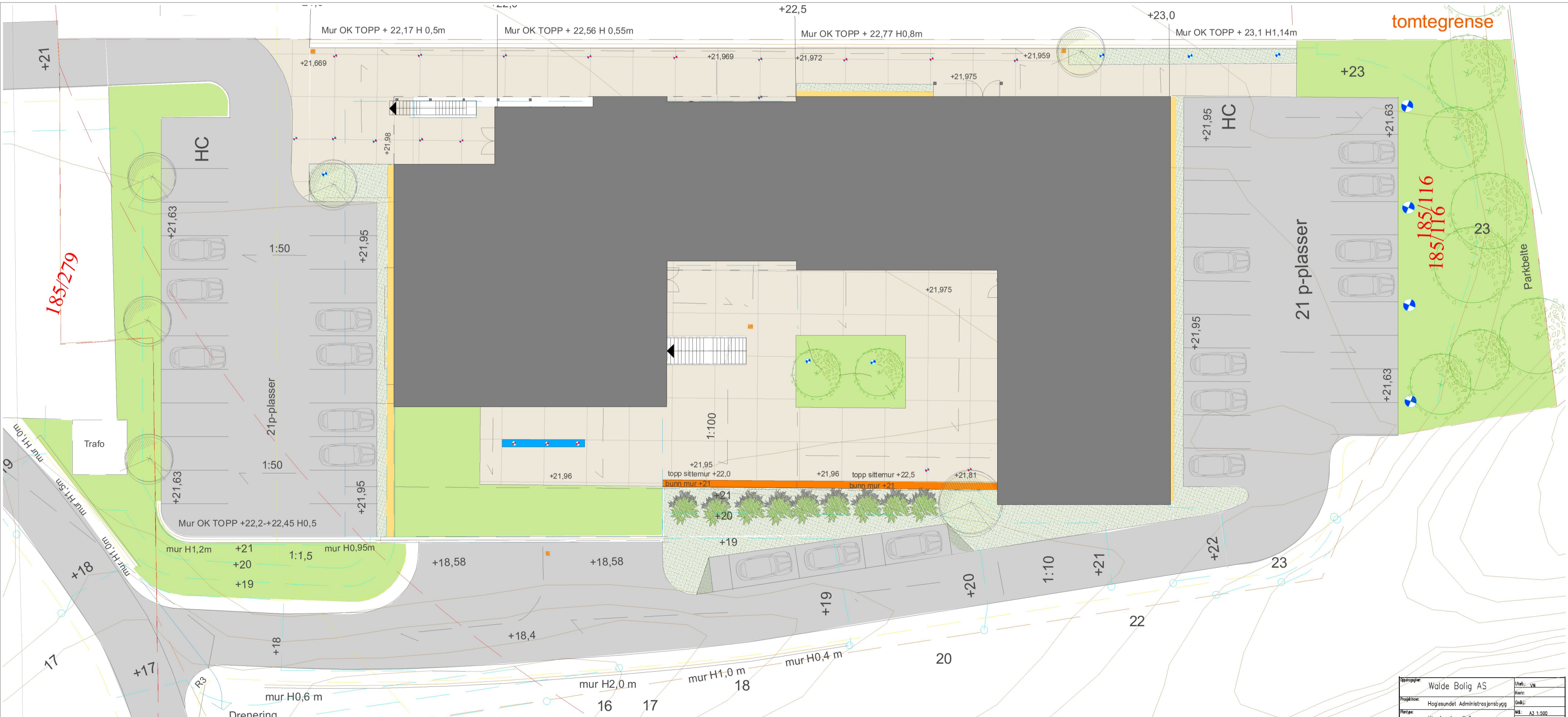
Situasjonsplan "som innsøkt i endret rammesøknad 20.08.2012"