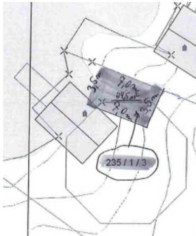
S.Kart – naustparsell 28.12.16