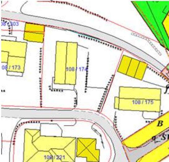
Kartutsnitt – gbnr 108/174