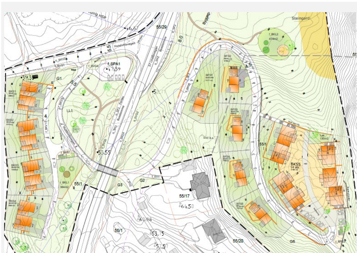
Utsnitt illustrasjonsplan 20.12.2018