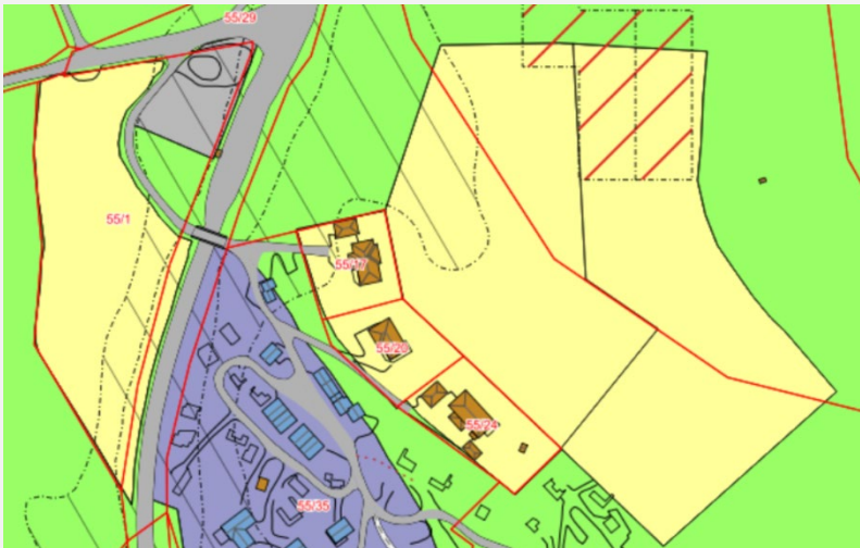
Utsnitt KPA 2011-2023

Kommuneplanens arealdel (KPA) syner kva arealbruksføre mål som gjeld for området og ramme for gjennomføring ligg i planføresegnene.