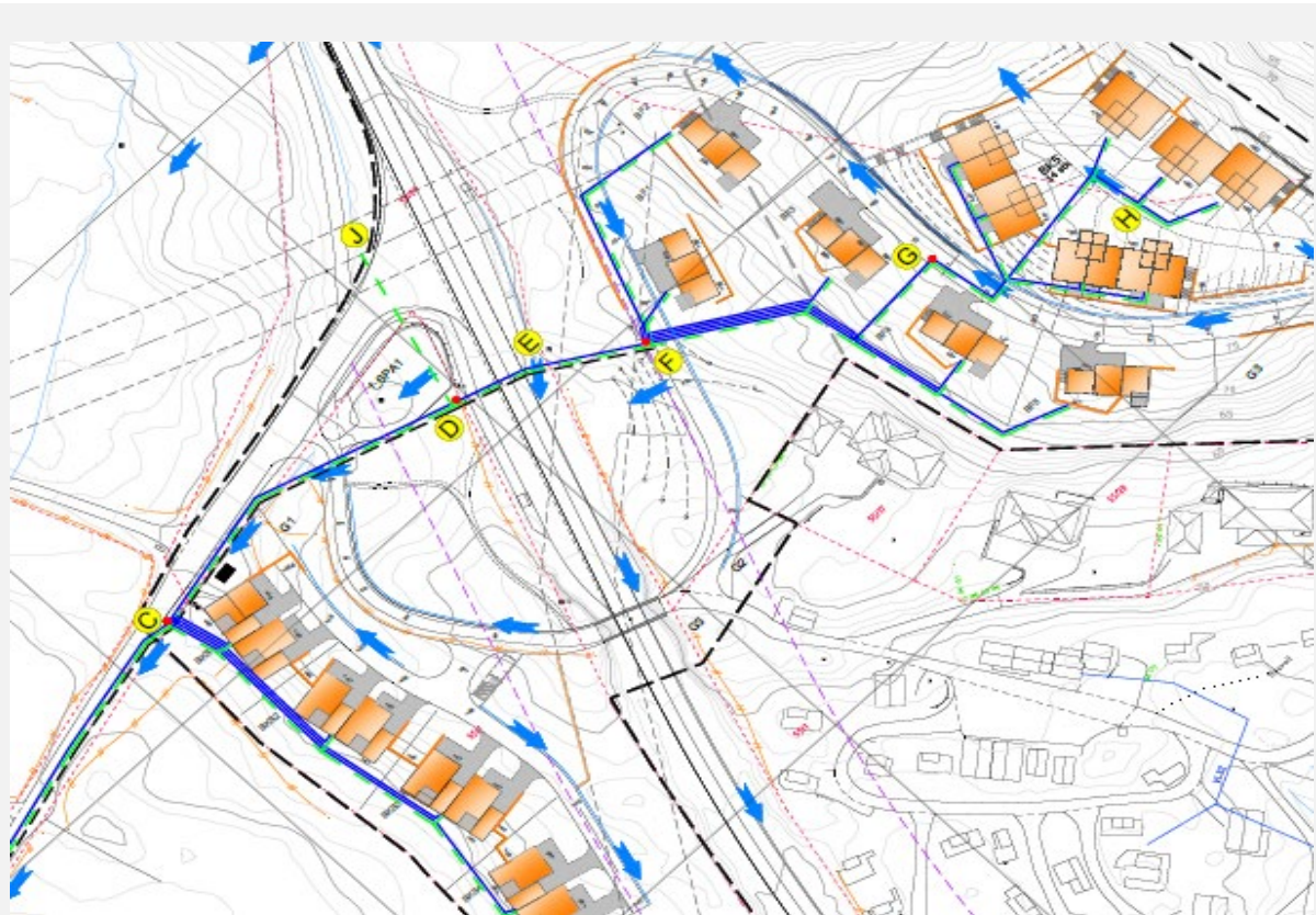
Utsnitt VA-rammeplan (RPVA) 20.12.2018