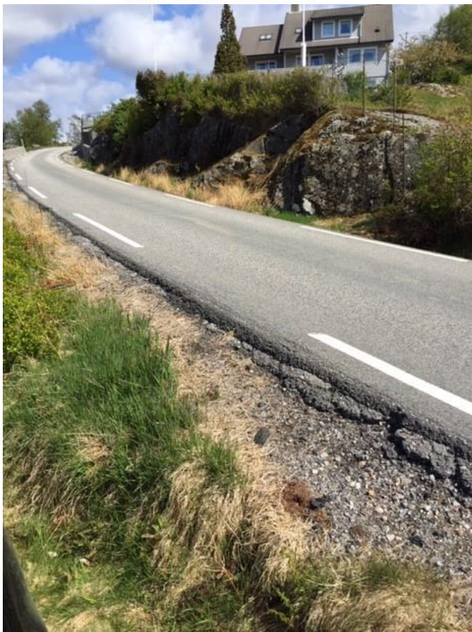
Foto viser sikt mot nord på FV 394