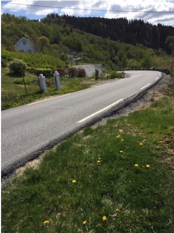
Foto viser sikt mot sør på FV 394