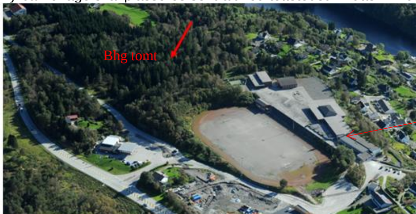
Bilde 1 –Tomt

Ny barnehage skal plasseres sentralt ved tettstedet Lindås i Lindås kommune.