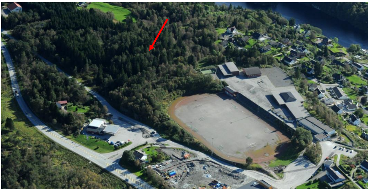
Bilde 2 – Bilde fra https://www.nordhordlandskart.no - temakart