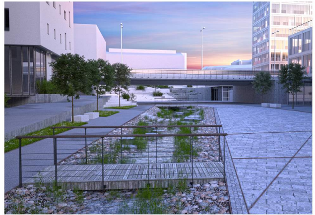
Vasskantvegetasjon og elvestein i elveleie.

For å unngå meir tilsig til eit røyrledningsnett som allereie har for stor belastning, skal alt overvatn handsamast i dagen. Det er naturleg å sjå overflatevatn og opninga av Lonena i samanheng, og løyse dette i ein felles plan. Kvassnesstemma har i dag for lite tilsig av vatn, og vil med jamne mellomrom tørke delvis ut, noko som skaper dårleg lukt, og utsjånad. Dette verkar i dag negativt på opplevingskarakteren på grøntområdet. Opning av Loneelva og open handtering av overvann vil auke vasstilsiget, og betre denne situasjonen.