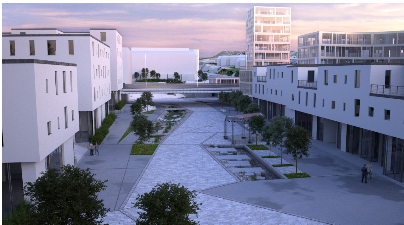
Gjennomgåande gangsone gjennom heile allmenningen, med plantefelt, elveløp og møbleringssoner på kvar side.

Nordre del av allmenningen har eit større torggulv; omkransa av eit amfi med trapper og rampar inn mot Knarvik senter. Søndre del av allmenningen har ei sentral gangsone, med møbleringsfelt og elveløp på kvar side. Høgden på allmenningen sør for Kvassnesvegen fell ned mot friområdet. Sjølve gangåra på allmenningen har her eit slakt fall, medan areal nærast bygga på kvar side (i aust regulert til off/priv tenesteyting, i vest til sentrumsføremål) er bygd opp for å sikre god kommunikasjon mellom bygg