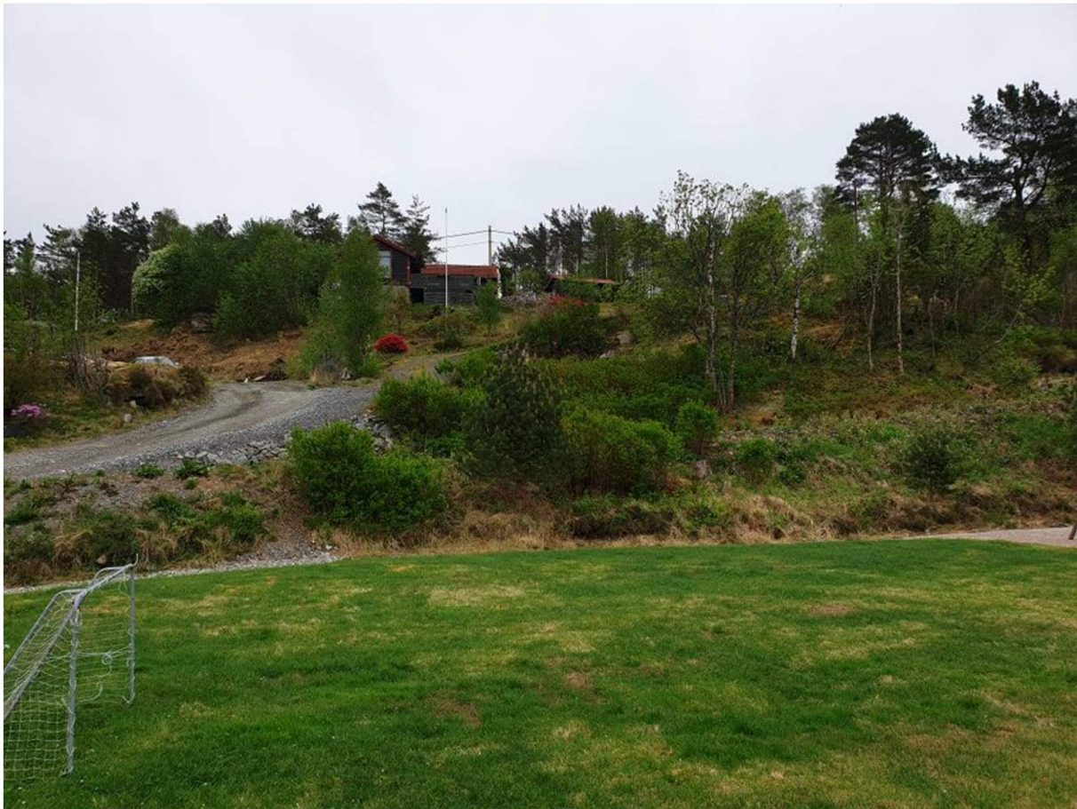
Figur 3: Eksempel på skråningene over tomtene. Bildet er tatt midt på 214/99, retning øst. En ser at det er et tynt løsmassedekke og at terrenget for det meste er relativt slakt og godt bevokst av middels høy blandingsskog.