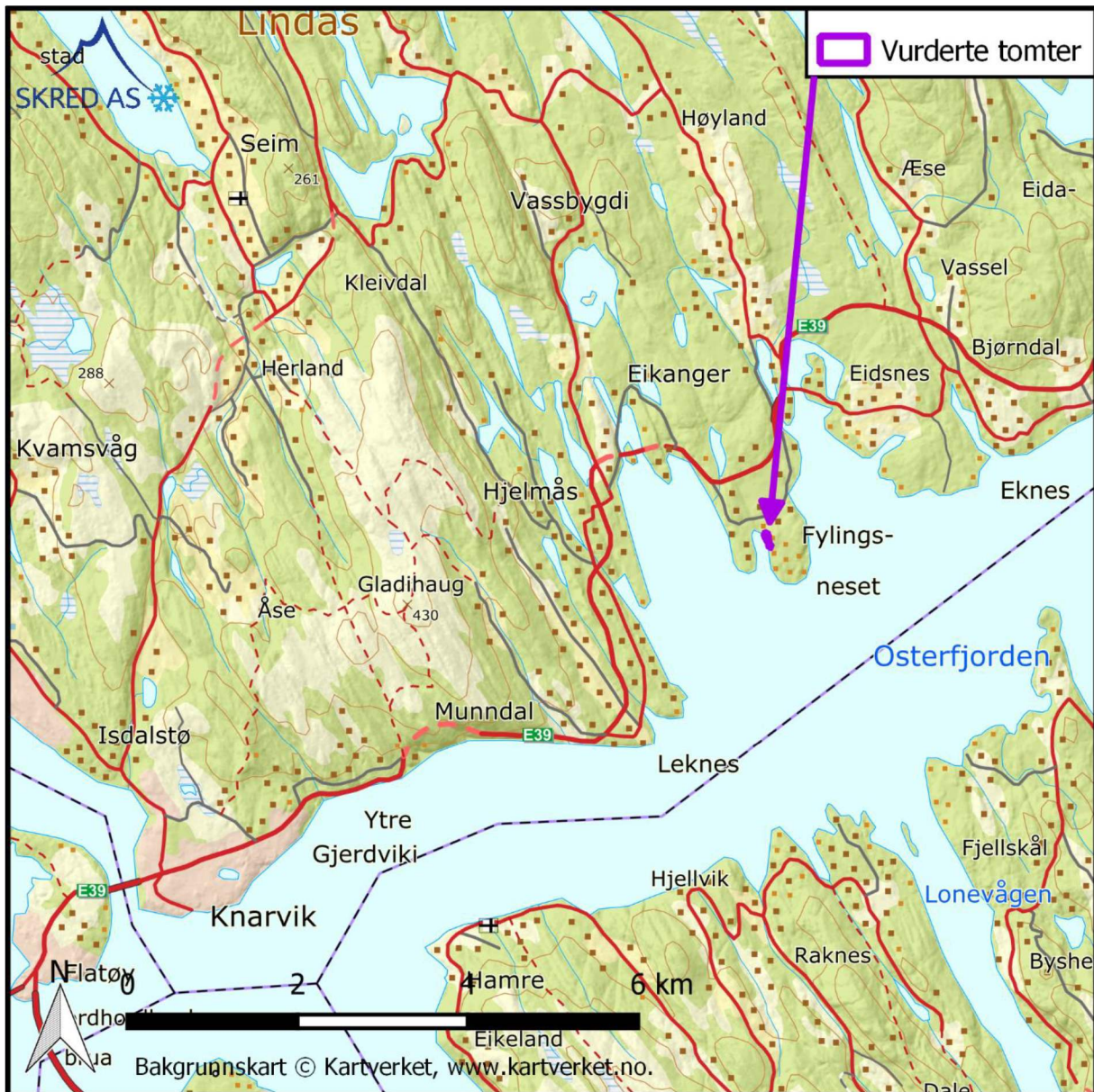
Figur 1: Lokaliseringen av de vurderte tomtene på Fyllingsnes, 7 km nordøst for Knarvik.

Det er søkt om godkjenning av arealplan Nyestøltunet på Fyllingsnes 7 km nordøst for Knarvik i Lindås kommune (Figur 1). Aktsomhetssonene for snøskred og steinsprang (NVE, 2018) dekker delvis de tre tomtene GBnr. 214/94, 97 og 99. Det ønskes derfor en detaljert skredfarevurdering for de tre boligtomtene.