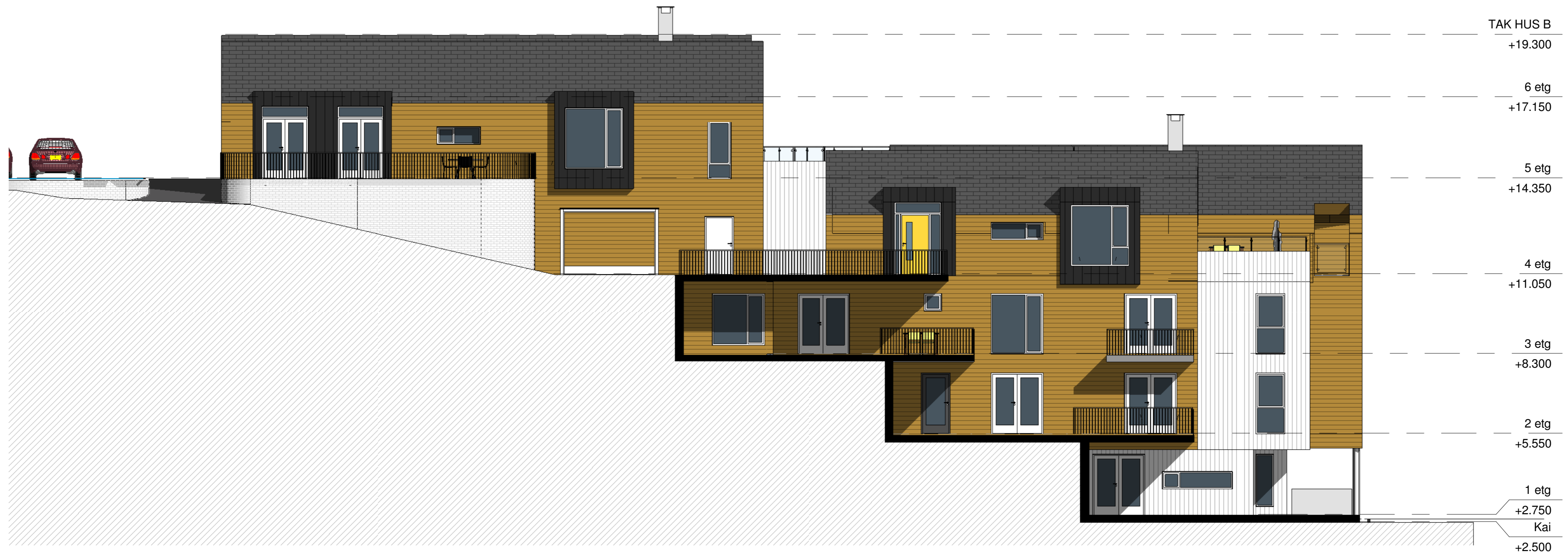
Hus B fasade Nord