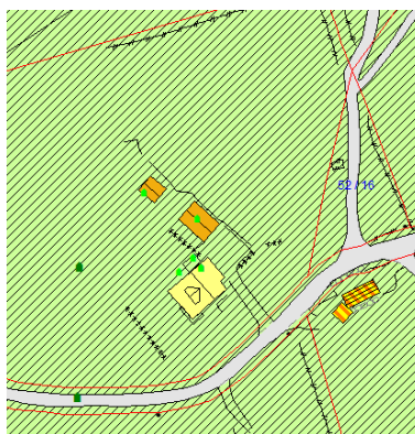
Utsnitt NIBIO, 13.06.18