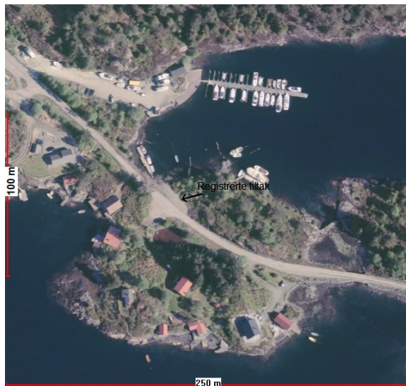
Kart og ortofoto.

Statens vegvesen ber Lindås kommune følgje opp denne saka etter plan- og bygningslova og undersøkje om det er gjeve løyve til tiltaket. Dersom dette er eit tiltak det skal gjevast løyve til, må det også søkast om etter veglova.