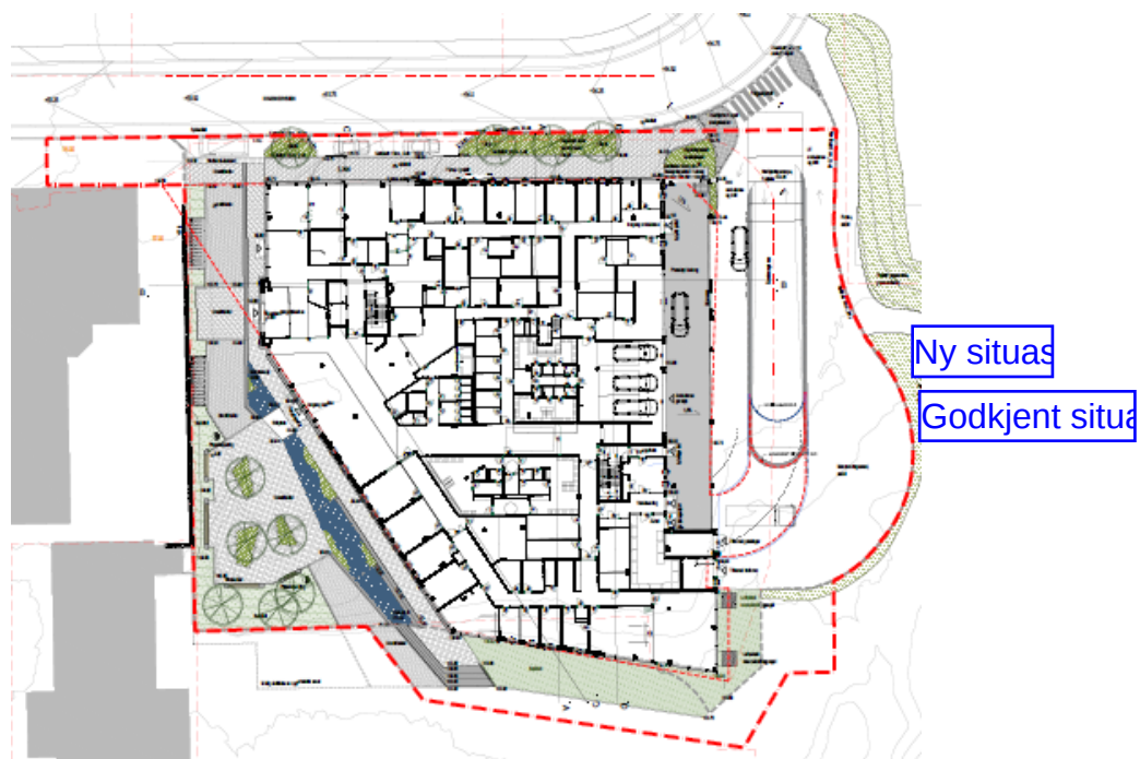
Bilde 4: Utomhusplan med godkjent- og ny situasjon

Ettersom prosjertert bue over nedkjørsel er i strid med regulert utforming, krever tiltaket formelt en dispensasjon fra reguleringslinje «tunell/parkering under bakken (1245)» og «føremålsgrense».