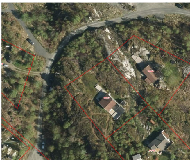
Kartutsnitt, nordhordlandskart, flyfoto

veientreprenør og Lindås kommune vedrørende innfrielse av rekkefølgekravet. Det er derfor ikke søkt om dispensasjon fra § 2.5.2 i denne søknaden.