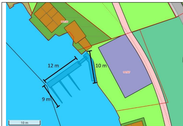
Kai og flytebrygge

Vi viser til brev frå kommunen datert 25.06.2019. Saka gjeld dispensasjon frå reguleringsplan for etablering av flytebrygge og fritidsbustad med to einingar for utleige.