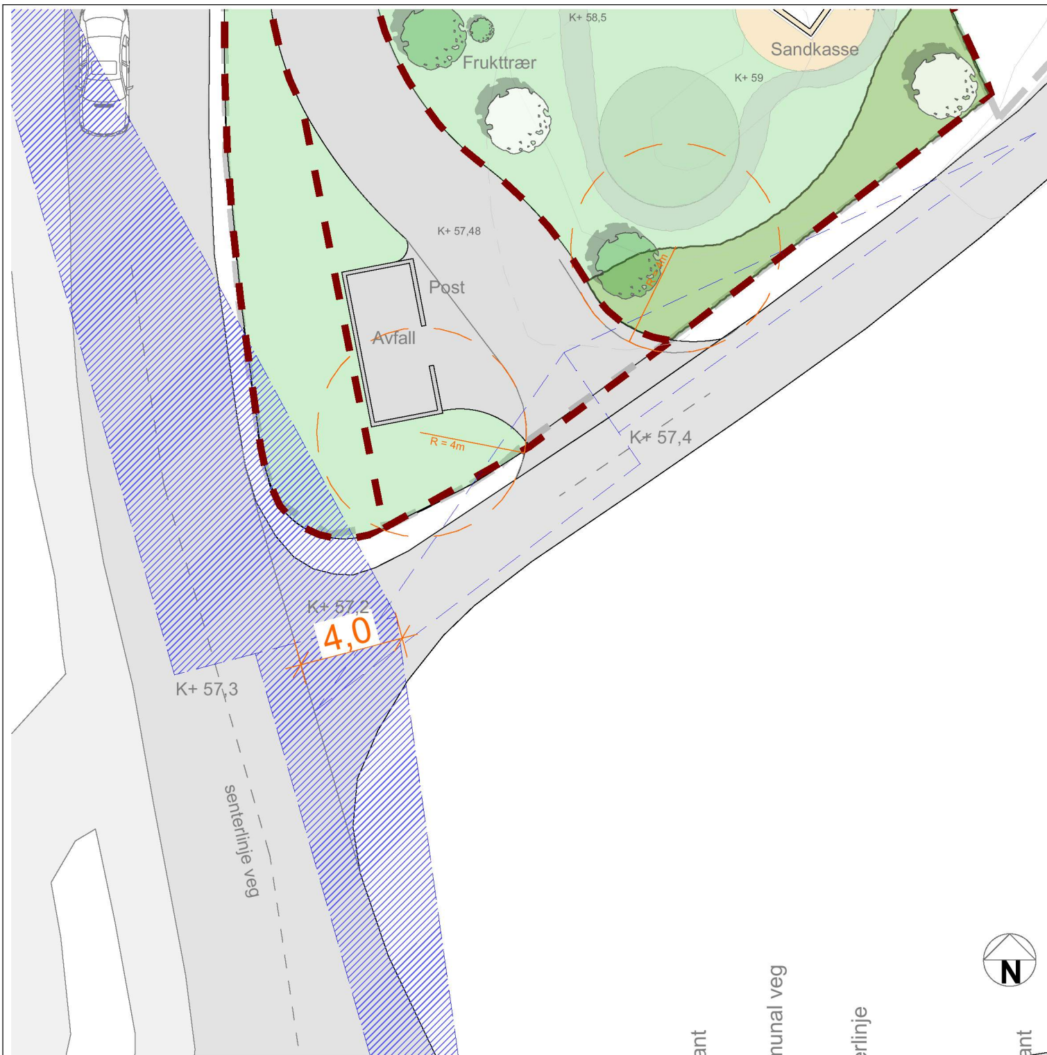
Utsnitt situasjonsplan 1:200 Avkjørsel med siktlinjer