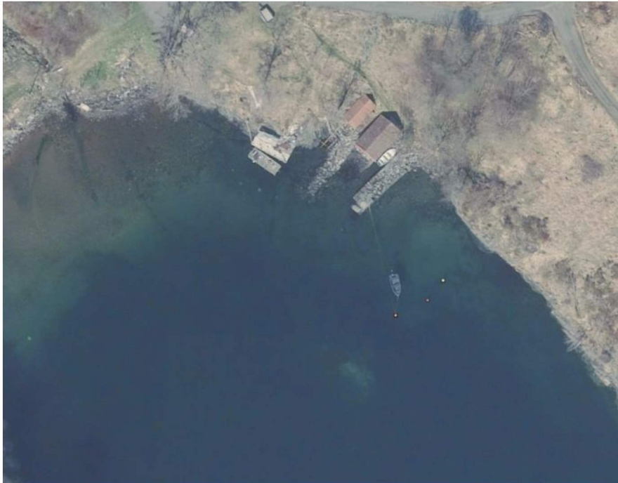
Bilde av eksisterende situasjon