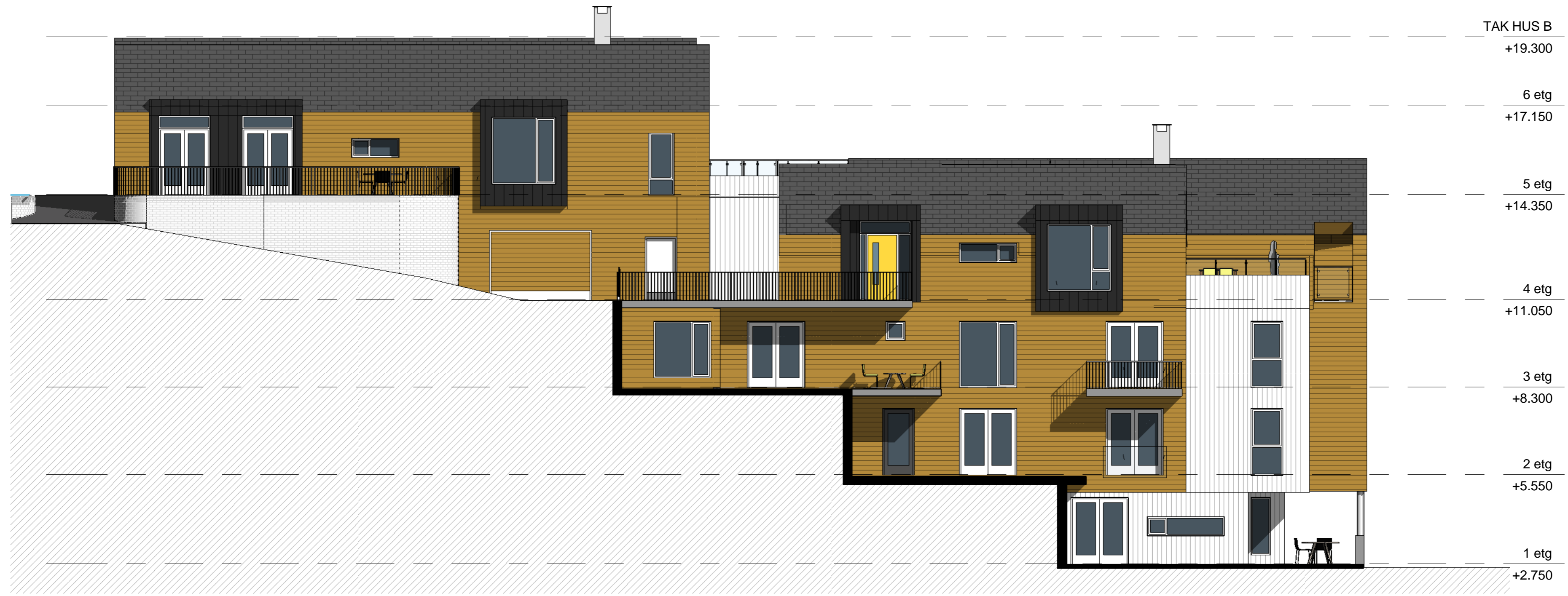
① Hus B fasade Nord 1 : 100