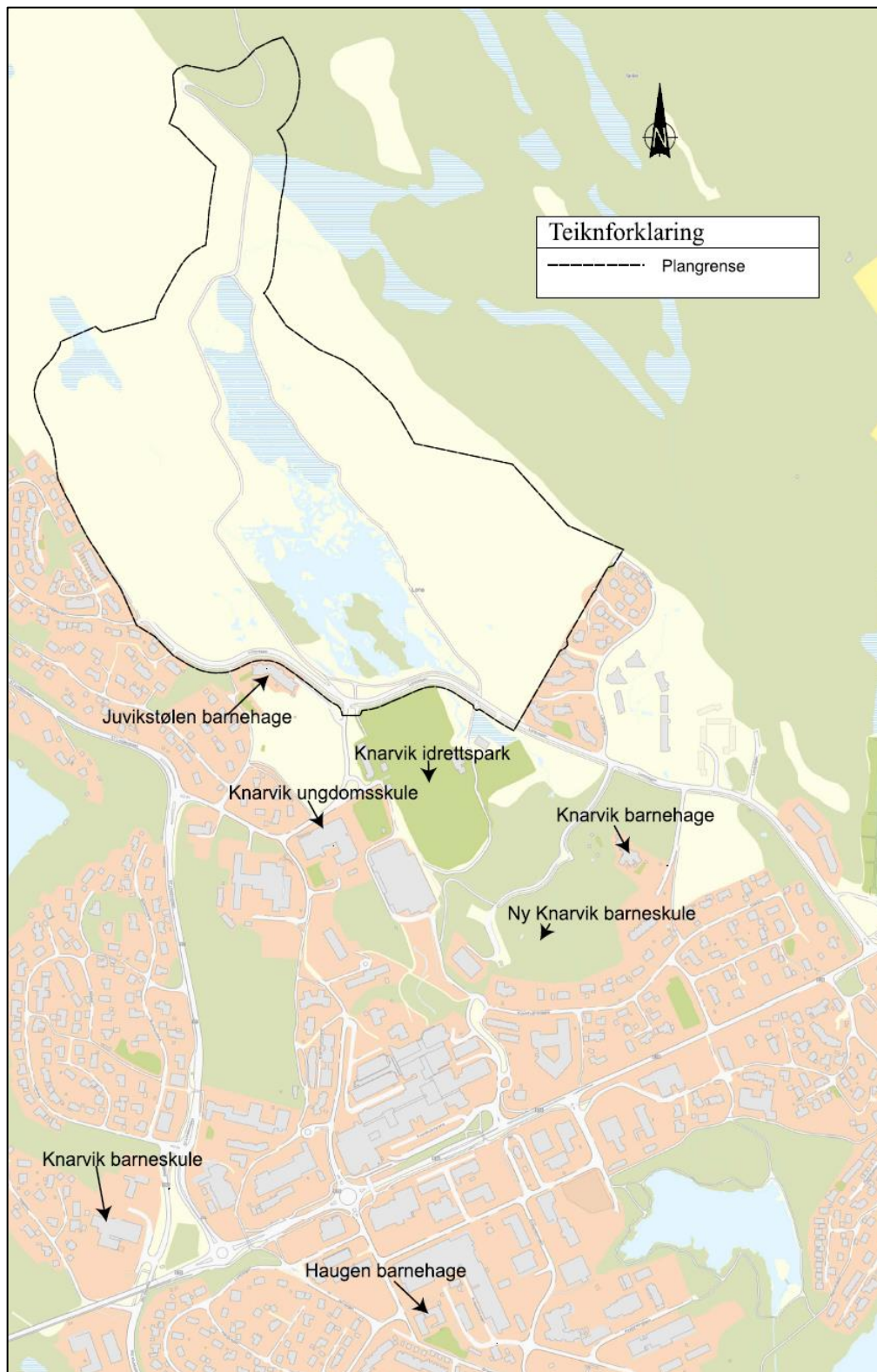
Figur 3 Oversiktskart som viser plassering av barnehagar, skular og idrettspark i høve planområdet

I dei følgende avsnitta vert kapasiteten til sosial infrastruktur vurdert i høve barnehage, barneskule, ungdomsskule og idrettsanlegg. Alle tema ligg i nærleiken av planområdet, i Knarvik skulekrins, som vist i kartet under.