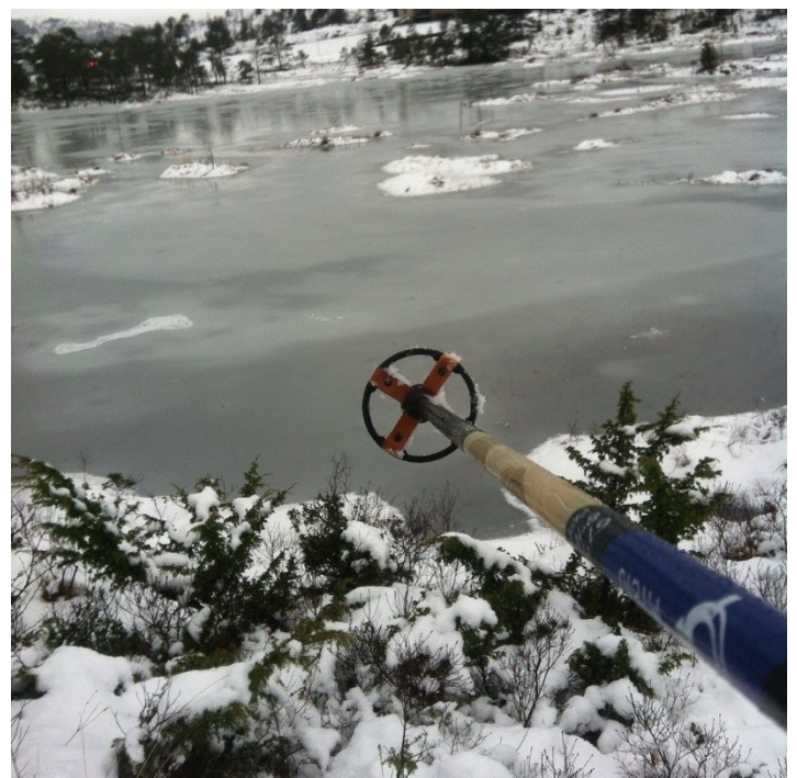
Figur 3 På ski rundt Brekkeløypa