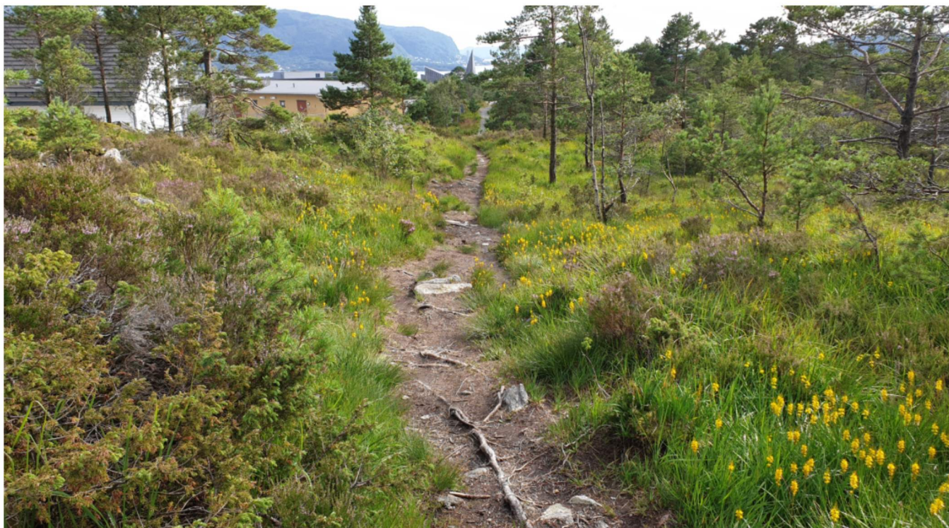
Sti sett fra Sør i retning sti-nett videre til 1.BKK bakken, 2. Gamleskolen og 3. Stegane