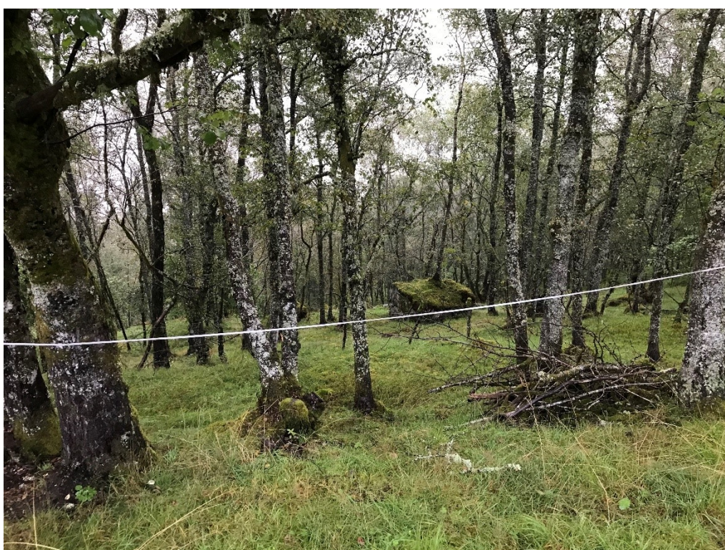
Over viser terrenget opp mot hesteberget. Tatt ovanfra og nedanfra