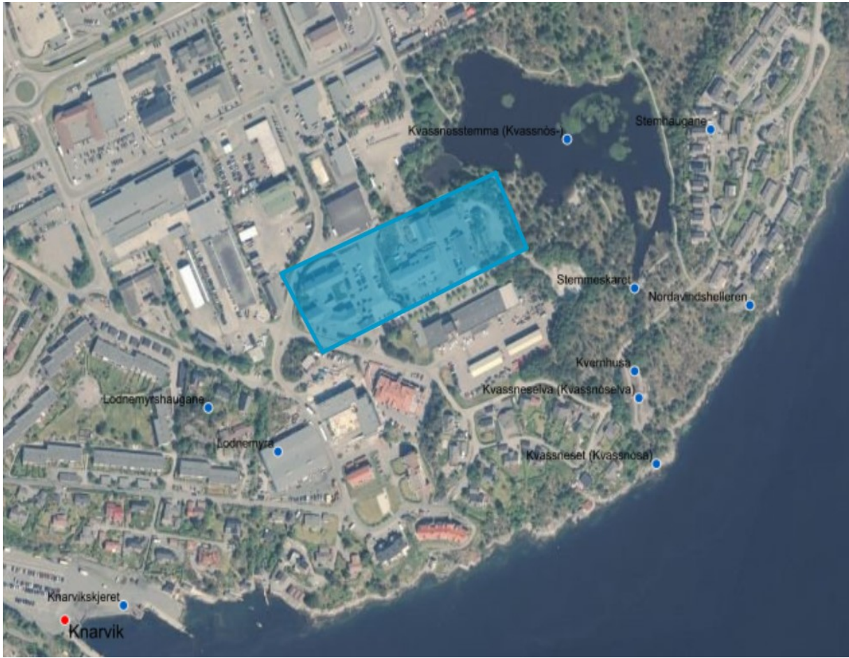
BOP3 område med krav om felles detaljreguleringsplan