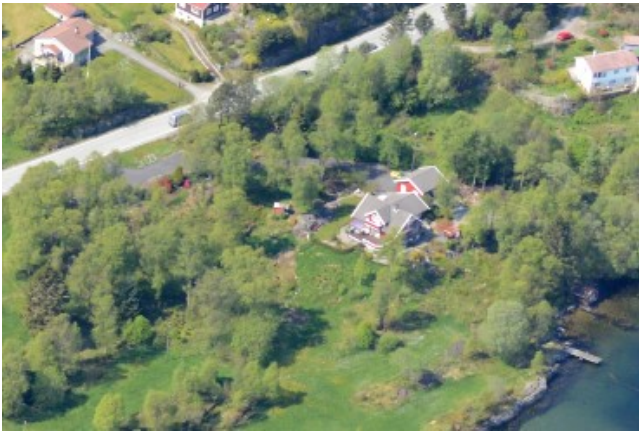
Bilete under syner omsøkte eigedomsgrenser