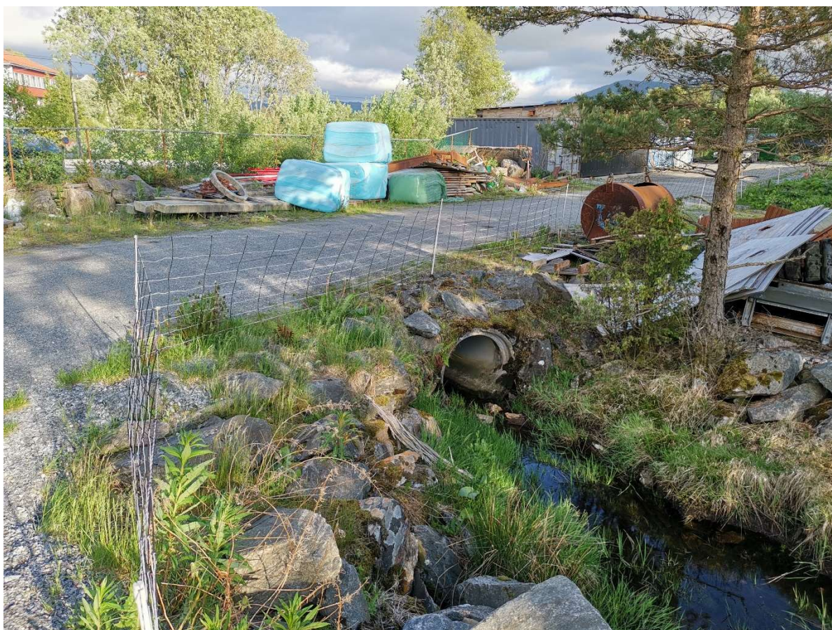
Figur 1. Bekken ledes i nytt plastret løp på utsiden av p-plass. Nytt bekkeinntak må på plass.

Øst i planområdet er det planlagt med en utvidelse av dagens parkeringsplass nedenfor svømmehallen. Den planlegges utvidet i nordlig retning, utover dagens utmarksområde. Det vises til mottatt plan fra landskapsarkitekt i Asplan Viak som viser utstrekning av ny p-plass. I området ved ny planlagt parkeringsplass er det i dag en mindre bekk. Bekken ledes inn i et DN800mm rør uten et skikkelig inntaksarrangement, og videre til utslipp i større inntak nede ved fotballbanen. I forbindelse med utvidelse av p-plassen må det settes av nok plass ved siden av slik at det kan etableres et nytt åpent bekkeløp her. Bekkeløpet plastres med stor flat stein for å hindre erosjon på massene rundt. Også selve bekkeinntaket utføres på nytt med skikkelig steinfang og rist med overløpsfunksjon for å gjøre løsningen mer robust mot større flomhendelser. Selve bekkeinntaket utføres med fordel i en større dimensjon enn hva eksisterende rørdimensjon er for å sikre en hydraulisk bedre utnyttelse av røret.