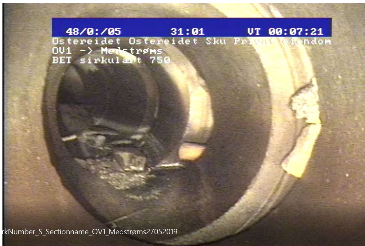
Figur 2 Eksisterende OV trase fra svømmehall. Store skader. Anbefales fjernet og lagt på nytt.

skjøtene i ledningen. På deler av strekket er glipene så stor at kameravogn til Vitek ikke kunne passere. Dette må det ordnes opp i, da en så stor utlekking som her finner sted, vil over tid føre til utvasking av masser, og stor fare for setninger på overflaten. Skadene er av en sånn art at rørtraseen anbefales å legges på nytt.