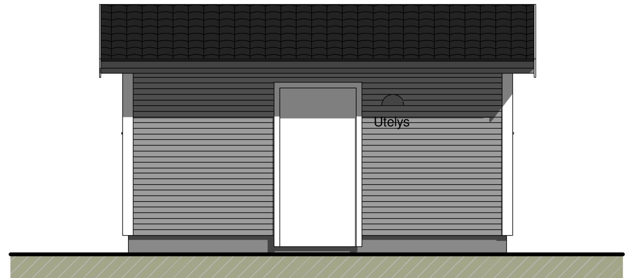
1 Nord. 1 : 50