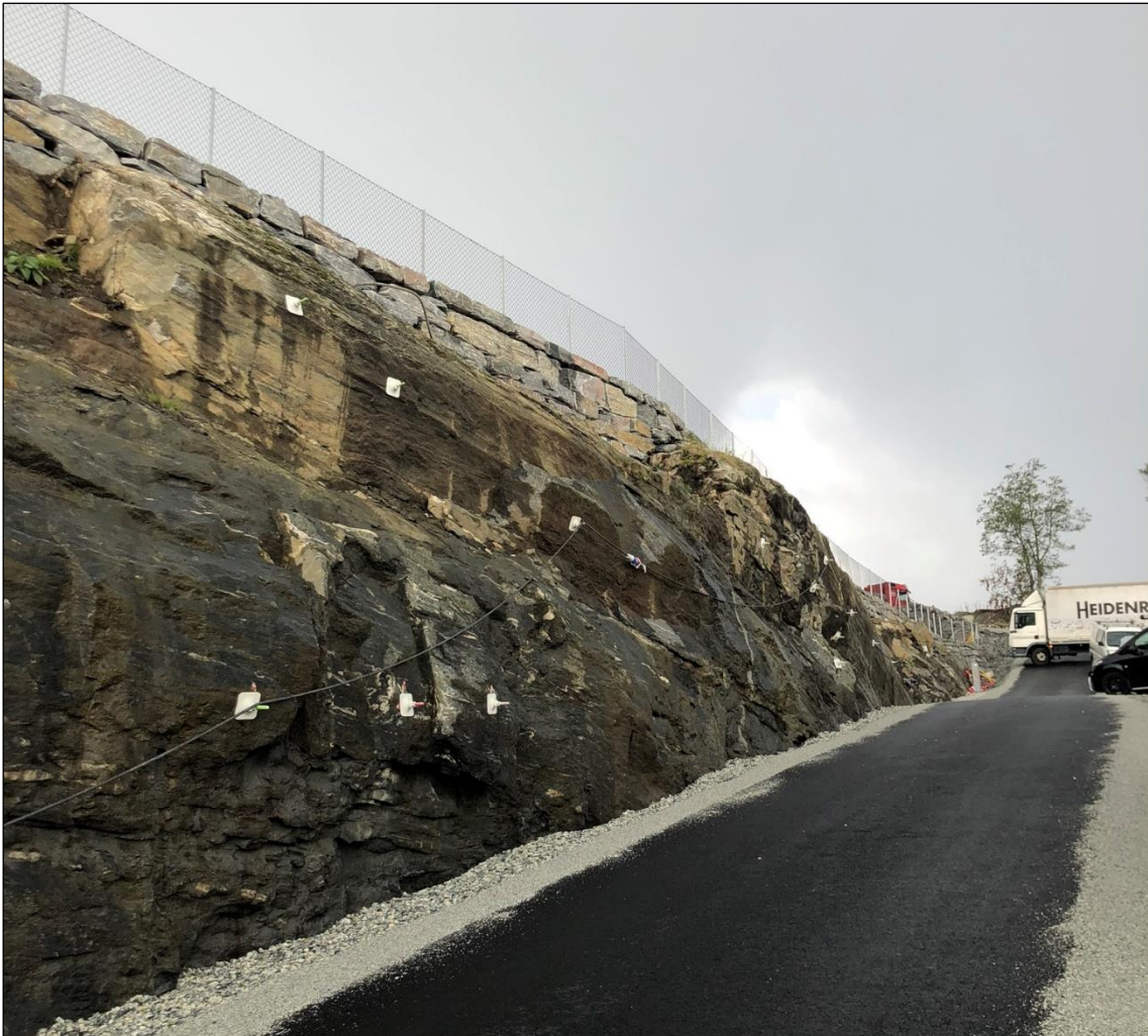
Figur 4: Boltesikring i nordlig del av bergskjæring langs veg.