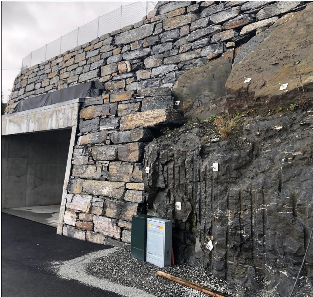
Figur 2: Boltesikring i sørlig del av bergskjæring langs vegen.

Sweco var på befaring vår 2018 og markerte for boltesikring langs vegen. I ettertid er denne sikringen, i tillegg til noe mer installert. Figur 2-4 viser installert sikring i dette området. Det er benyttet 3 meter lange bolter. Det er installert 25 bolter. I tillegg ble det benyttet forbolter med lengde 1 og 3 meter i den sørligste delen.