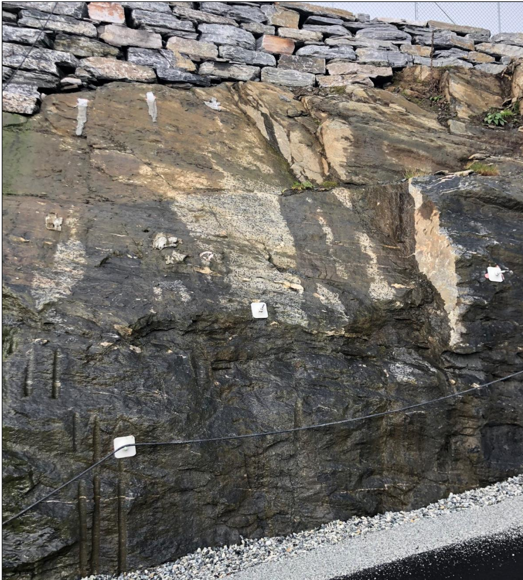
Figur 3: Boltesikring i bergskjæring langs veg. Hull for forbolter sees i underkant av tørmur.