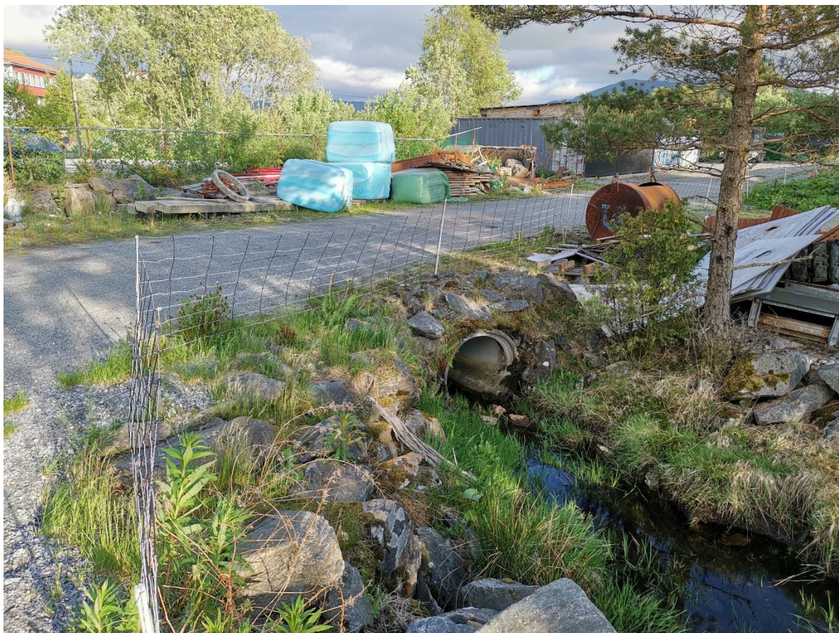
Figur 1. Bekken ledes i nytt plastret løp på utsiden av p-plass. Nytt bekkeinntak må på plass.

Selve bekkeinntaket utføres med fordel i en større dimensjon enn hva eksisterende rørdimensjon er for å sikre en hydraulisk bedre utnyttelse av røret.