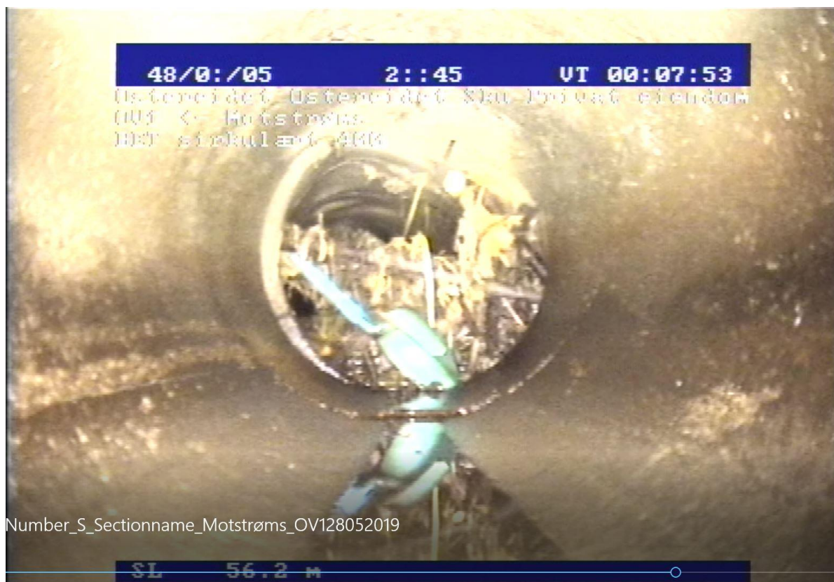
Figur 3 Eksisterende ledning blokkert av gjenstander

Vest i planområdet ved Ostereidet senter har det i tidligere revisjoner av VA-rammeplan vært vist at i nedbørsfelt B4, ref. tegning G002, er det en flomvei. Dette er vann som tidligere trodde at rant sørover og ut av nedbørsfelt B1. Vi har nå erfart at vann som renner ut av nedbørsfelt B1 vil renne nordover, og renne gjennom tunnel under E39. Det er dermed ikke noen stor flomvei som vil renne inn i nedbørsfelt B4, slik tidligere antatt.