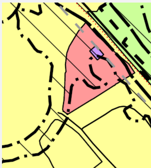
Utsnitt revidert KDP Knarvik - Alversund