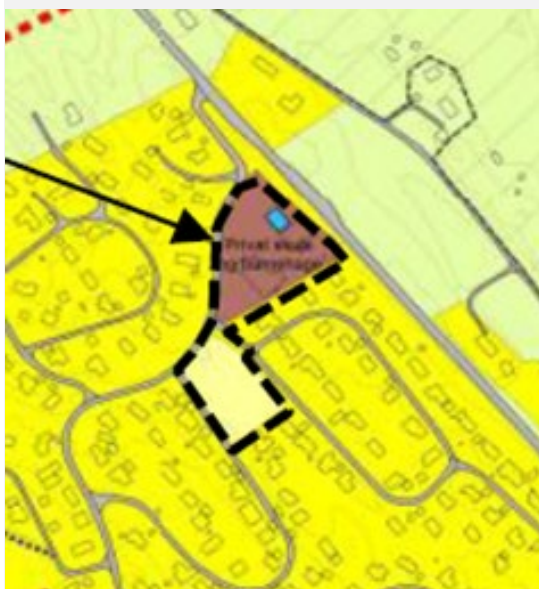
Utsnitt KDP Knarvik – Alversund

I utgangspunktet gjev «Kommuneplanens arealdel» (KPA) ramme for bruk og utnytting av areal. For dette området gjeld «Kommunedelplan (KDP) for Knarvik-Alversund». Denne gjev ramme for utforming og gjennomføring.