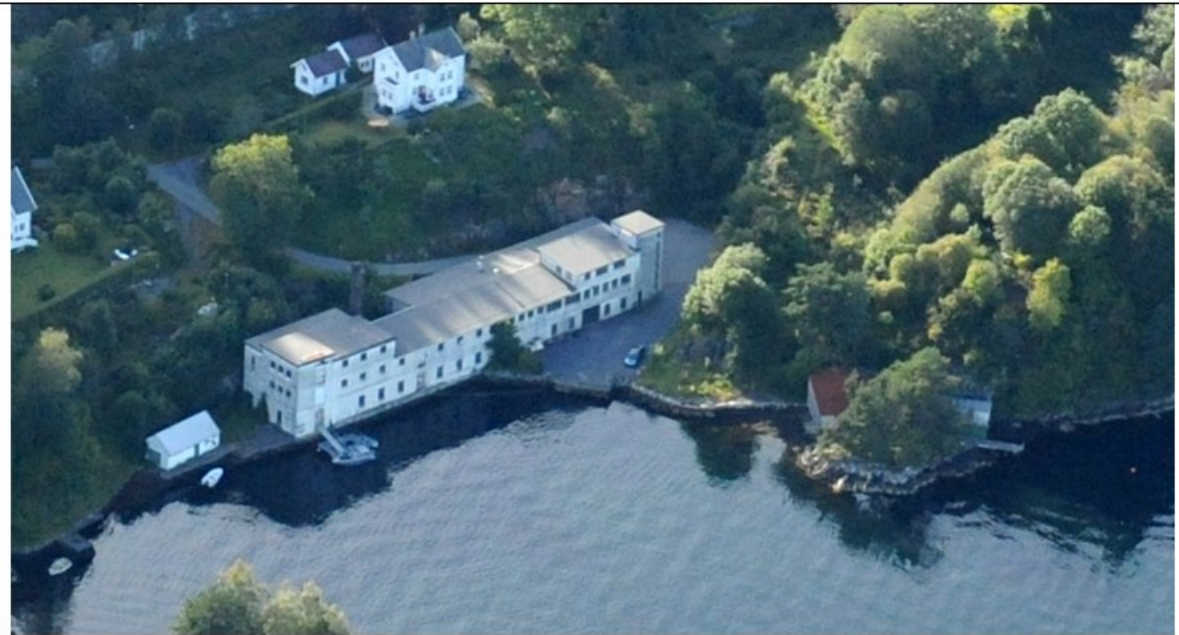
Tidlegare Sellevoll Plast

Søknaden vart sendt på høyring til Fylkesmannen i Vestland og Hordaland fylkeskommune ved Kultur- og idrettsavdelinga. Det har ikkje komme merknader til søknaden.