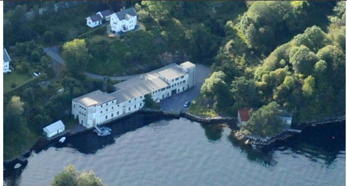
Tidlegare Sellevoll Plast

Søknaden vart sendt på høyring til Fylkesmannen i Vestland og Hordaland fylkeskommune ved Kultur- og idrettsavdelinga. Det har ikkje komme merknader til søknaden.